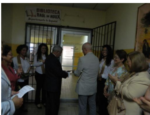
Corte de cintas de la nueva Sede de la Cátedra UNESCO.