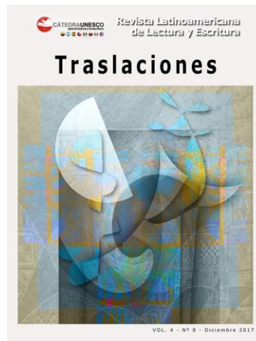
Tabla de contenidos

PROCESOS DE LECTURA Y ESCRITURA MEDIADOS POR TECNOLOGÍAS