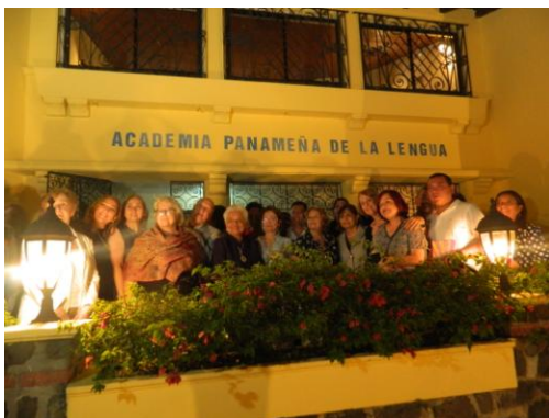
Acto realizado en la Academia Panameña de la Lengua